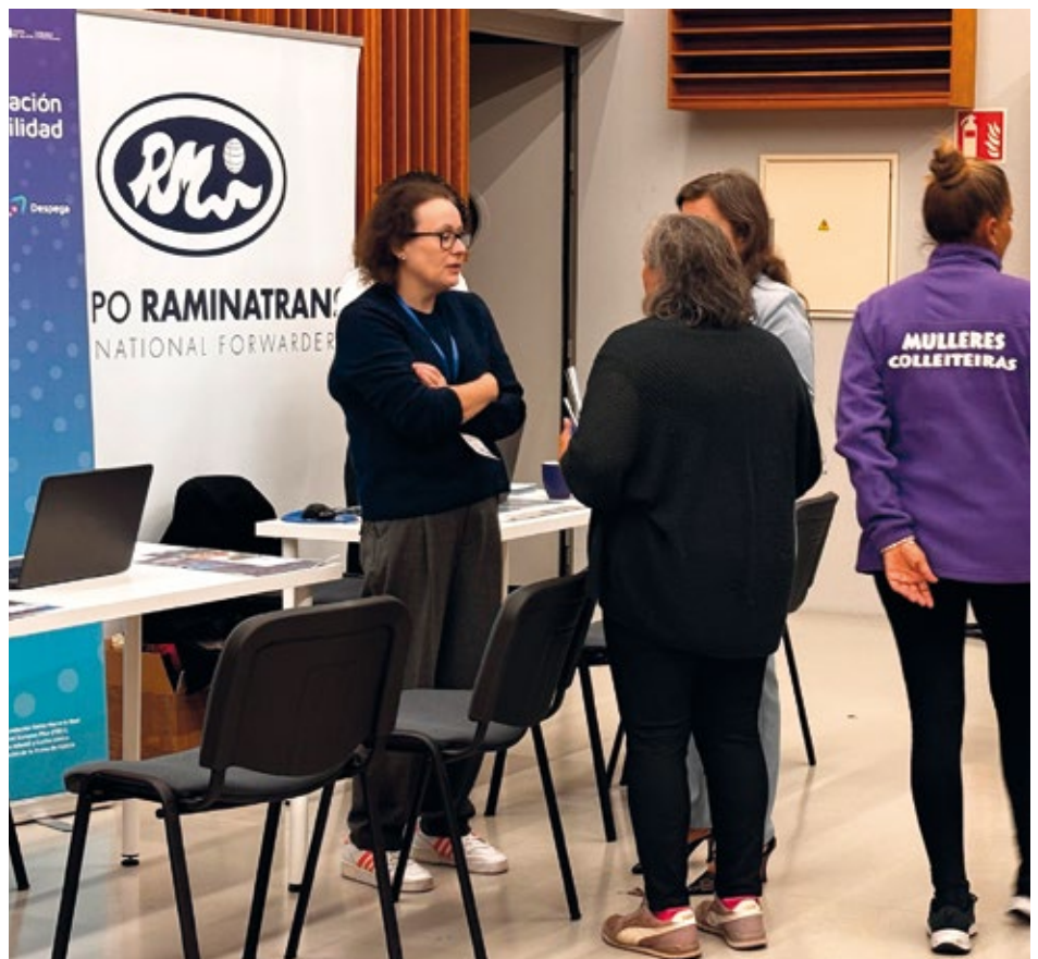
Stand de Raminatrans

https://www.raminatrans.com/conocenos/#trabaja-con-nosotros