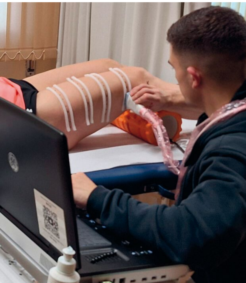
Proyecto Care Grupo PHG

A lo largo de su trayectoria ha logrado consolidar un espacio singular donde la universidad se convierte en motor de innovación y bienestar, demostrando que el ejercicio físico no solo mejora el rendimiento, sino que transforma la salud y la vida de las personas.